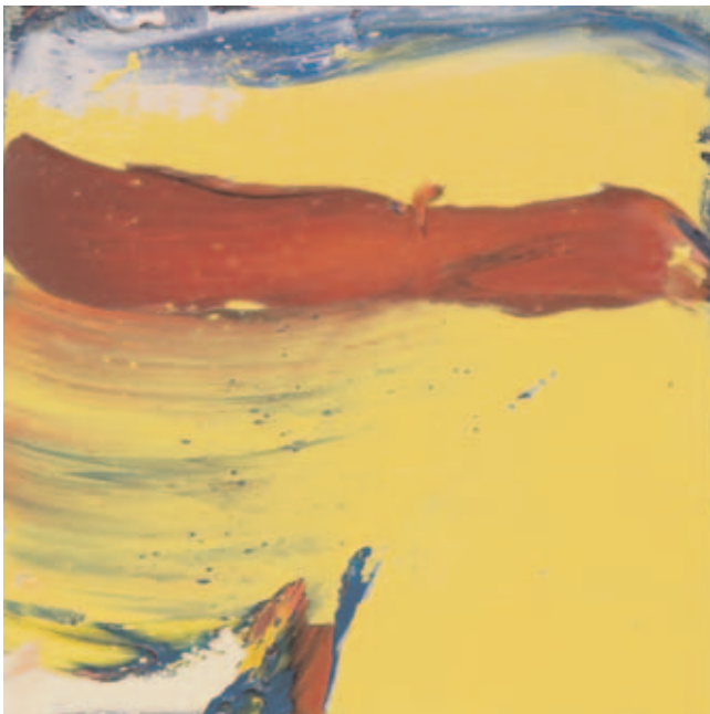
Peinture , 2005, huile sur bois, 20 x 20 cm