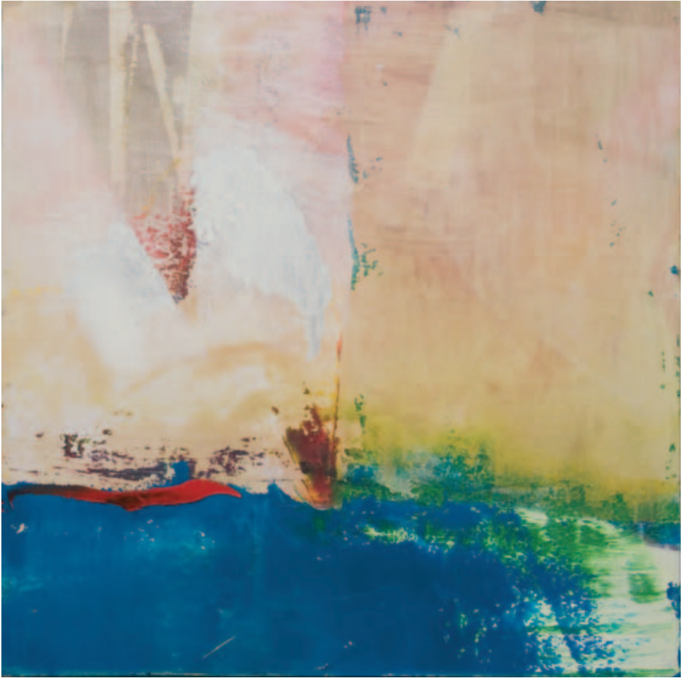
Peinture , 2005, huile sur bois, 122 x 122 cm