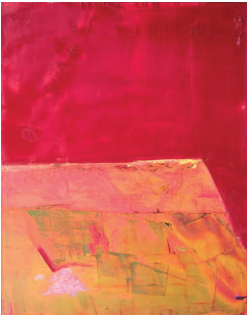
Peinture, 2005, huile sur bois, 90 x 70 cm