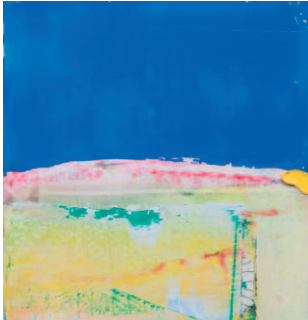
Peinture, 2005, huile sur bois, 32 x 30 cm