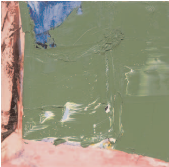
Peinture, 2005, huile sur bois, 22 x 22 cm Peinture, 2005, huile sur bois, 31,5 x 31,5 cm