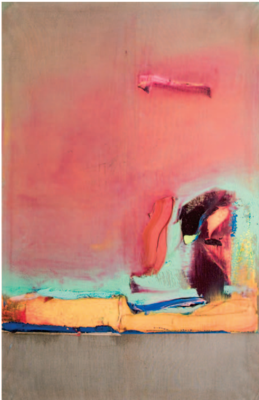
Peinture , 2005, huile sur toile, 140 x 91 cm