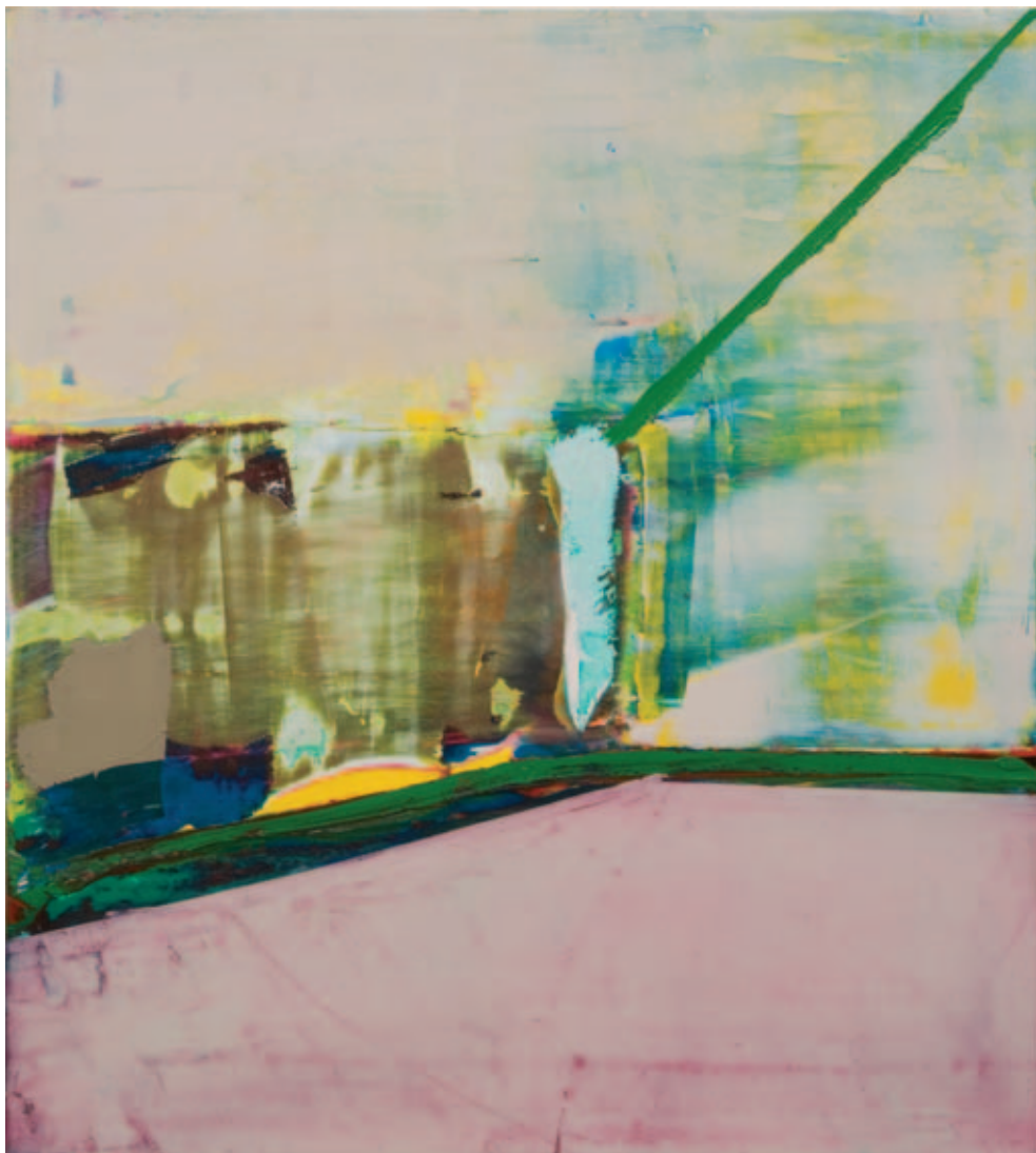
Peinture , 2005, huile sur bois, 100 x 90 cm < Peinture , 2005, huile sur bois, 131 x 119 cm